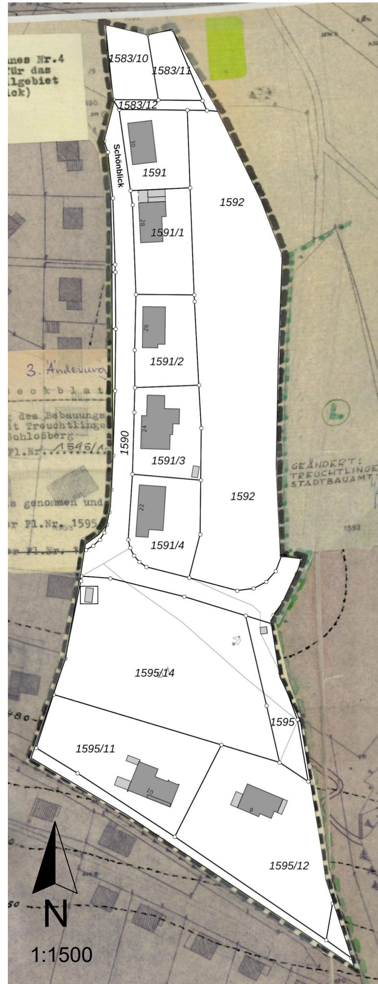
Aufhebung des rechtsverbindlichen BBP TR 4 "Schlossberg" in Treuchtlingen