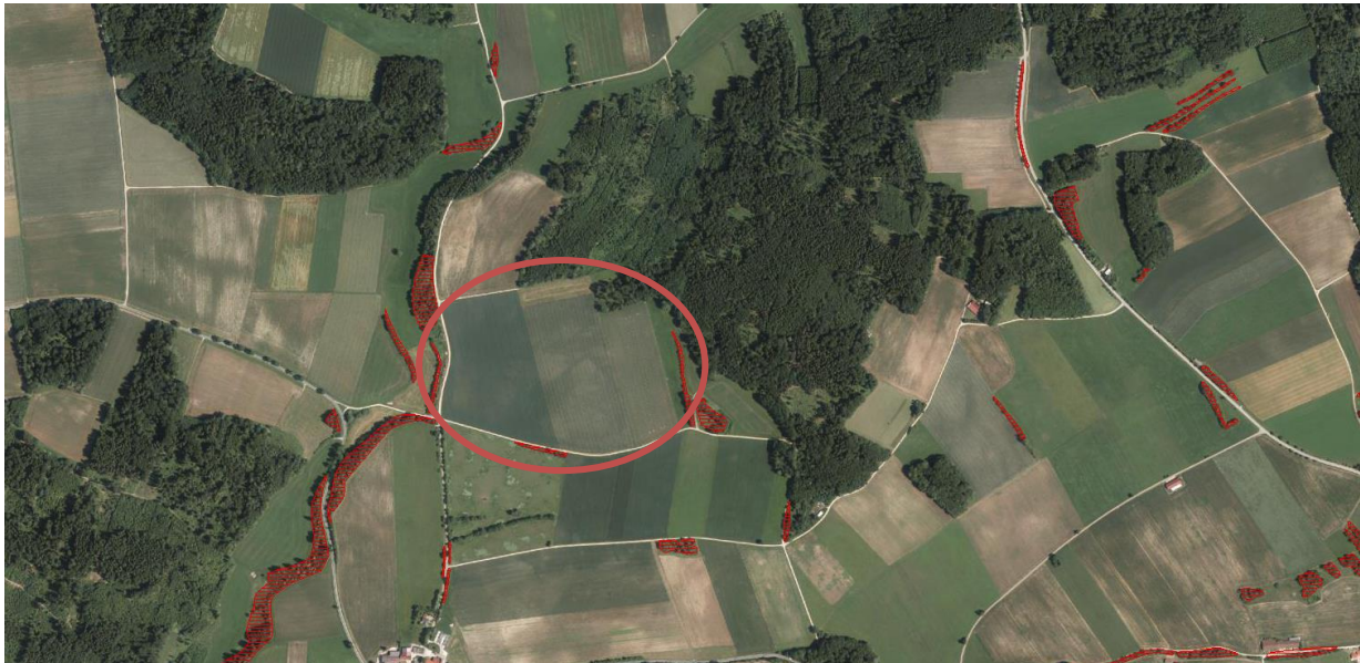
Abbildung 1: Auszug aus Biotopkartierung

Es werden keine Flächen nach ABSP oder Biotopkartierung überplant. Kartierte Biotope stehen nicht in funktionellem Zusammenhang mit den überplanten Flächen.