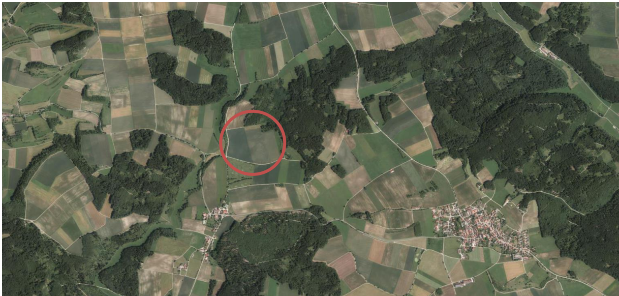
Landschaftsbild - rot: Geltungsbereich des Bebauungsplanes

Aufgrund der Höhenabwicklung und der Waldbestände im Umfeld bestehen keine Blickbeziehungen von der Fläche aus in Richtung der umliegenden Ortschaften. Durch die angrenzenden Waldflächen, die eine Kulisse bilden, bietet sich die Fläche für eine landschaftsbildschonende Nutzung als Photovoltaikanlage an. Daher kommt der Einbindung in die Landschaft vor allem im Nahbereich um die Anlage eine Bedeutung zu, eine signifikante Fernwirkung ist nicht zu erwarten.