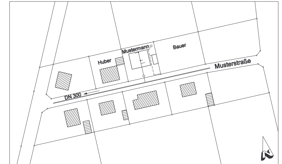
Lageplan M 1:1.000

Musterplan 2: Entwässerung eines Einfamilienwohnhauses ohne Keller im Mischsystem mit Oberflächenwasserversickerung