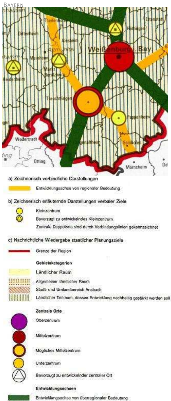
ABBILDUNG 4: ZIELE DER RAUMORDNUNG UND LANDESPLANUNG