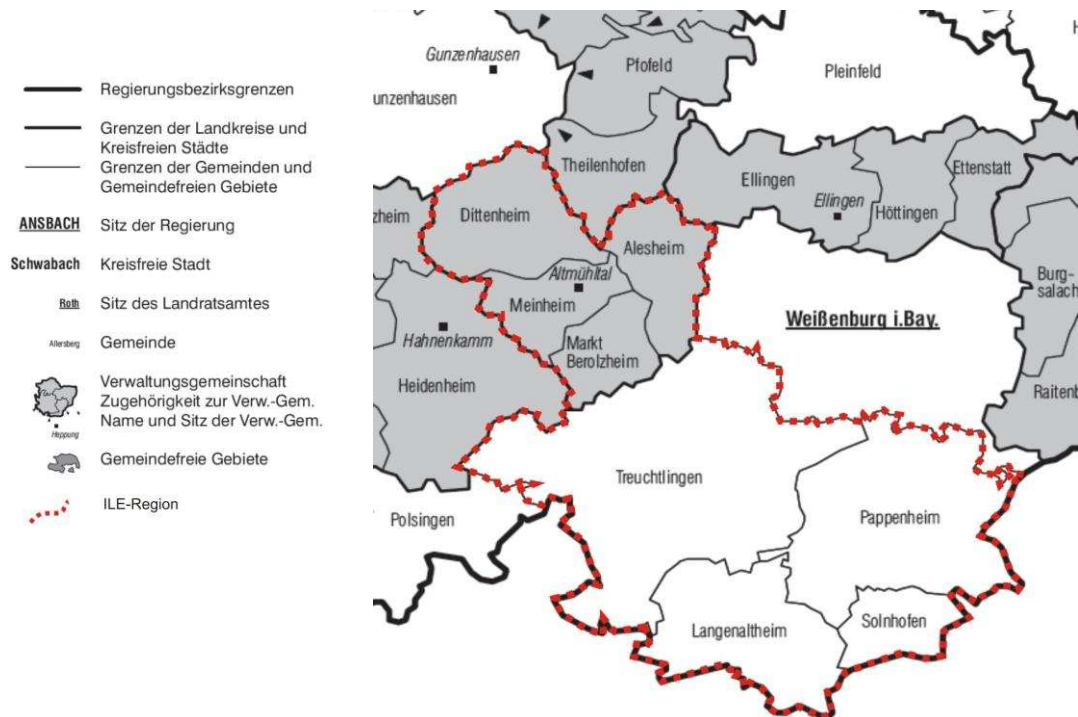
ABBILDUNG 2: GEBIETSUMGRIFF "INTEGRIERTE LÄNDLICHE ENTWICKLUNG ALTMÜHLTAL"

QUELLE: REGIONALPLAN DER PLANUNGSREGION 8 WESTMITTELFRANKEN